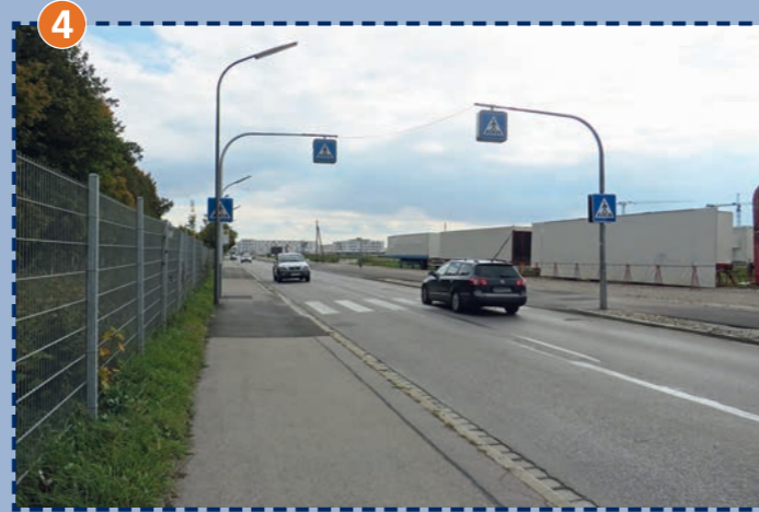
4 Den Zebrastreifen nur überqueren, wenn der Verkehr steht (Achtung Busverkehr) oder kein Fahrzeug in Sicht ist.