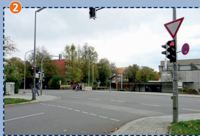
2 Kreuzung Wiesentfeller Straße/Riesenburgstraße: mit Ampelanlage, Busverkehr – bitte besondere Vorsicht!