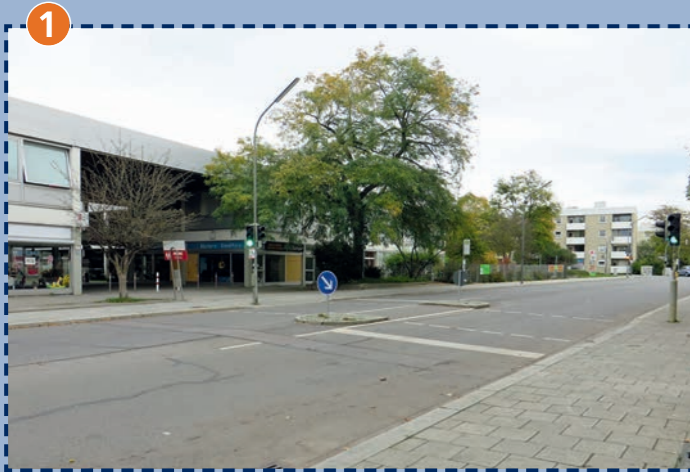
1 Fußgängerbedarfsanlage Wiesentfeller Straße: bitte Knopf drücken und nur bei „Grün“ überqueren!