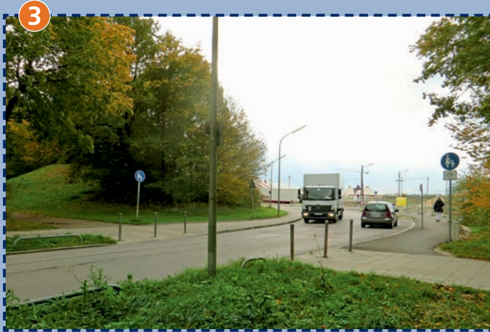
3 Das Überqueren der Wiesentfeller Straße vor (ungesichert) und hinter der Kurve (Zebrastreifen) ist gefährlich.