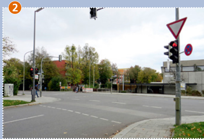
2 Kreuzung Wiesentfeller Straße/Riesenburgstraße: mit Ampelanlage, Busverkehr – bitte besondere Vorsicht!