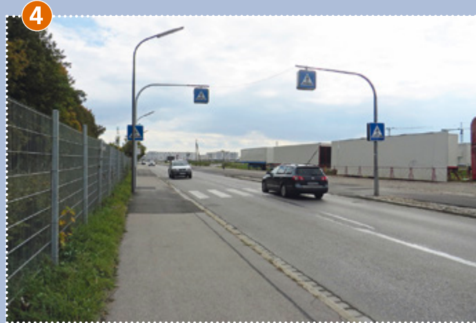
4 Den Zebrastreifen nur überqueren, wenn der Verkehr steht (Achtung Busverkehr) oder kein Fahrzeug in Sicht ist.