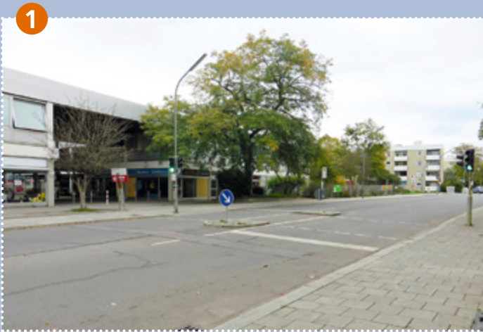
1 Fußgängerbedarfsanlage Wiesentfeller Straße: bitte Knopf drücken und nur bei „Grün“ überqueren!