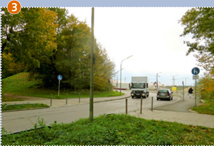
3 Das Überqueren der Wiesentfeller Straße vor (ungesichert) und hinter der Kurve (Zebrastreifen) ist gefährlich.